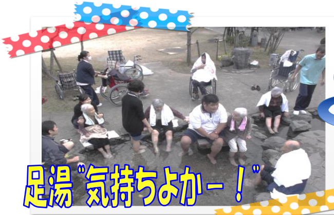
足湯“気持ちよかー！”