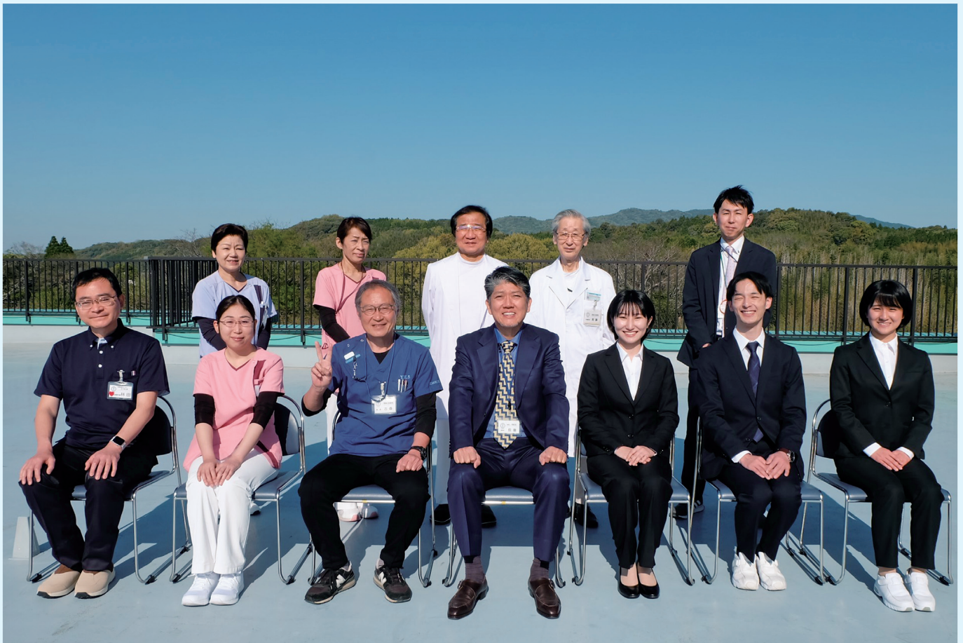
新年度オリエンテーション